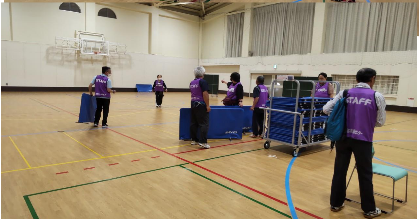
会場設営 各部署打ち合わせ 確認事項等がスタッフ間で共有がされた