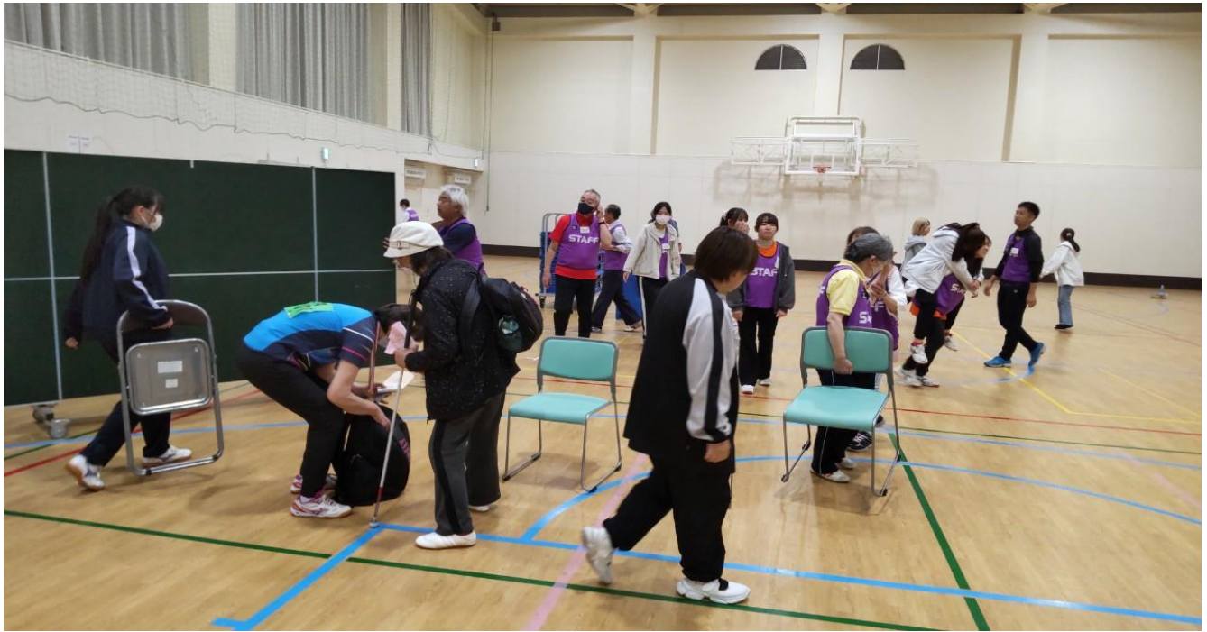
「モップ掛け」って スカッとする！！