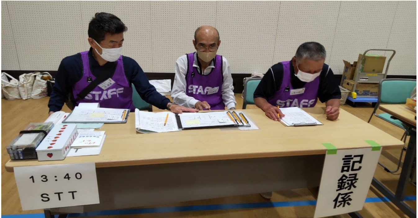
音が頼りの競技 神経と研ぎ澄ます選手 審判 篤く熱いが 静かな応援！！