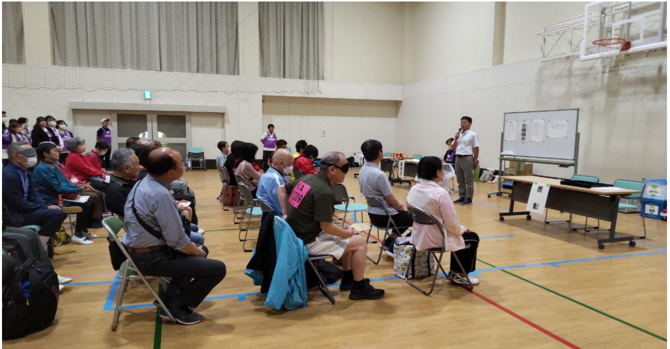
みんなが楽しみにしていた県スポーツ大会 競技の始まりです 主催者:あいさつ 審判長:競技上の注意事項など