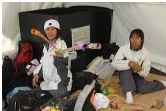
競技の合間 本部テントでくつろぐ選手