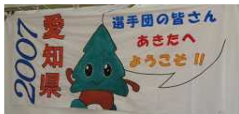
手作りの横断幕 本部テントに飾ってあります