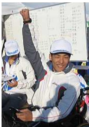
明日への意気込みを拳に込め...