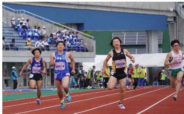
アンカー フィニッシュ！！