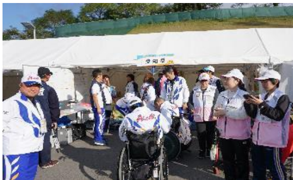
やっぱり陸上は屋外が！テントはいいですね