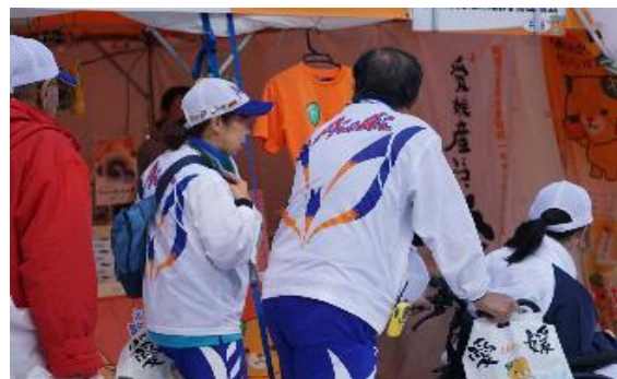
選手とふれあい広場へ