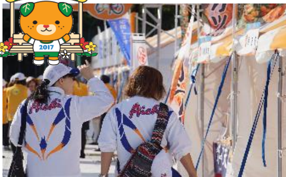
お土産 買えましたか？