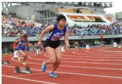
緊張の第1走者 いいスタートを切りました