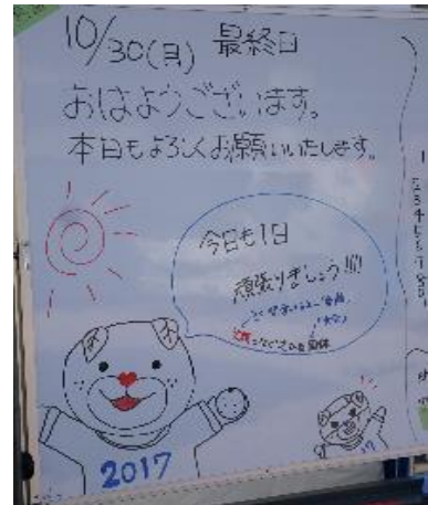
報道員控室の入口にも ウエルカムホワイトボードが...